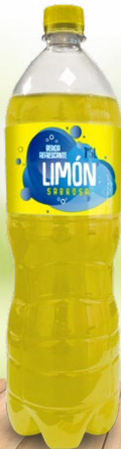
Limón Sabrosa Botella 1,5 L Ref. 9552