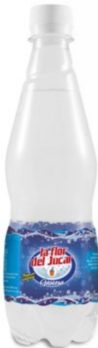
Gaseosa La Flor del Júcar Botella 0,5 L Ref. 0006