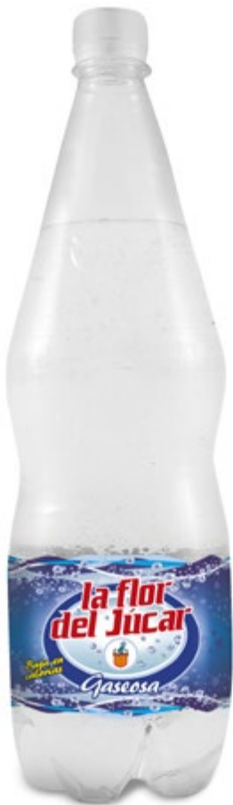
Gaseosa La Flor del Júcar Botella 1,25 L Ref. 0005