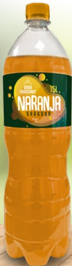
Naranja Sabrosa Botella 1,5 L Ref. 9553