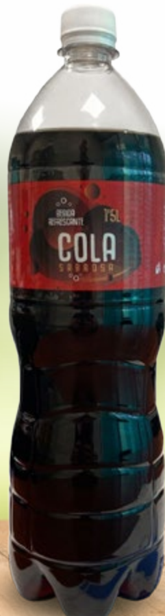
Cola Sabrosa Botella 1,5 L Ref. 9551