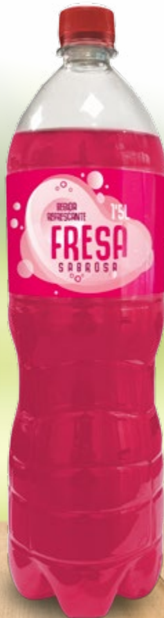
Fresa Sabrosa Botella 1,5 L Ref. 9555